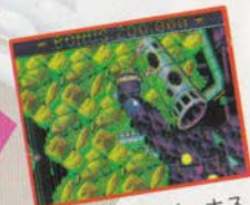
何回か回るとボーナス